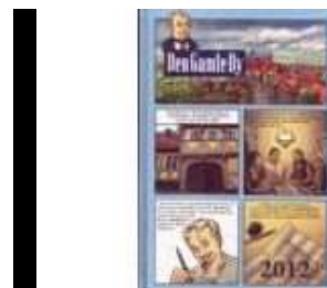
DEN GAMLE BY 2012