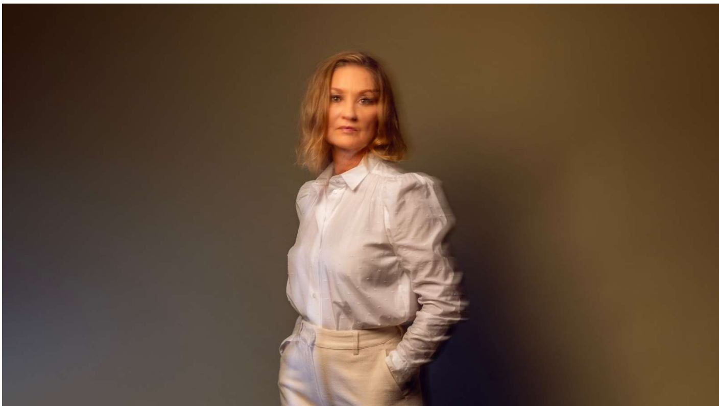
Naja Marie Aidt