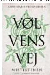
VØLVENS VEJ - MISTELTENEN

( https://www.historie-online.dk/boger/anmeldelser-5-5/romaner/vingskudt )