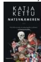
NATSVÆRMEREN OG GRANITMANDEN

( https://www.historie-online.dk/boger/anmeldelser-5-5/romaner/voelvns-vej-misteltenen )