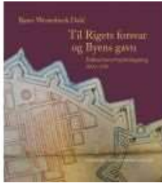
TIL RIGETS FORSVAR OG BYENS GAVN