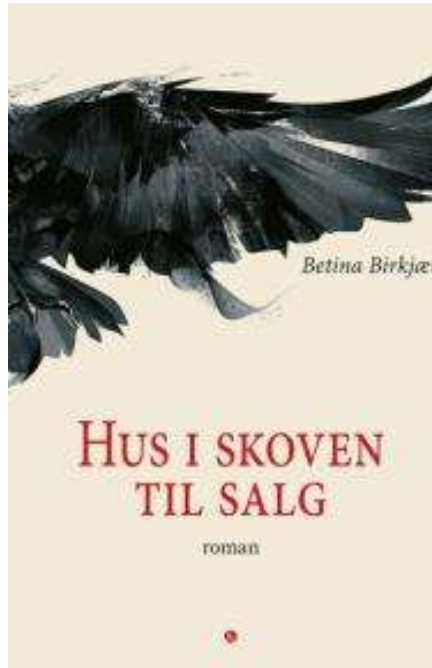
(/boeger/hus-i-skoven-til-salg-roman) HUS I SKOVEN TIL SALG (/BOEGER/HUS-I-SKOVEN- TIL-SALG-ROMAN) Af Betina Birkjær