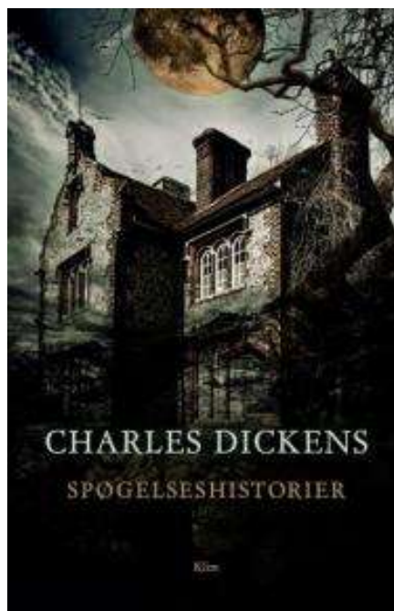
(/boeger/spoegelseshistorier) SPØGELSESHISTORIER (/BOEGER/SPOEGELSESHISTORIER) Af Charles Dickens