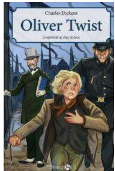
(/boeger/oliver-twist-ved-aage-nymann) OLIVER TWIST (VED MAJ BYLOCK) (/BOEGER/OLIVER- TWIST-VED-AAGE-NYMANN) Af Charles Dickens