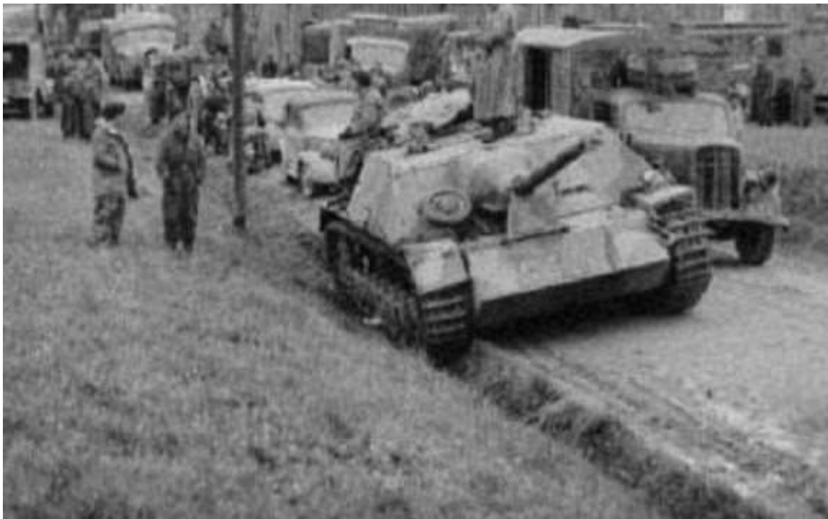
Panzer Regiment 11 under de hektiske kampe i 1945

Hans lidt for smarte optræden med falsk orden fra tjeneste i Den spanske Borgerkrig medførte en straf på seks måneders fængsel. Det havde Man imidlertid ikke "råd til", da der var brug for alle mand ved fronten. Han kom derfor i en straffebataljon i Ukraine, hvor hårde kampe fandt sted blandt andet ved Kharkov. Her blev han under rydningen af et minefelt såret i slut april 1943. Tre måneder senere var han dog tilbage igen. Men nu blev det hurtigt for meget for hr. Hazel, så han drak et glas vand, der var fyldt med tyfusbakterier. Igen lazarettet. Helt frem til januar 1944 – påstod han!