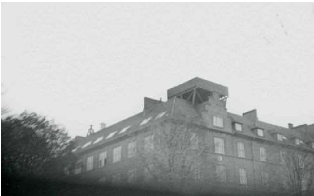
Nyboder Skole fotograferet i 1943. Bemærk platformen med antiluftskjts. Den dag i dag ligger den store tyske kommandobunker under jorden. Skolen fungerer stadig.

Han blev betegnet som jævnt begavet. Han kom, da forældrene flyttede, til Valby, kort i skole her. Det gik ikke godt, og i skoleåret fra oktober til juni 1929 havde han 93 sygedage. Han kom så til Vanløse skole, men droppede ud af 5. klasse allerede i 1931.