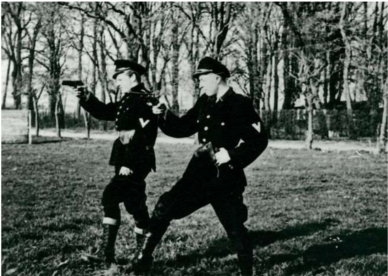
Hipofolk øver sig i pistolskydning på Høvelte Kaserne, hvor de havde uddannelsessted.