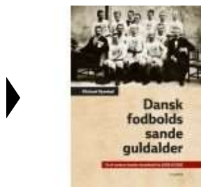
DANSK FODBOLDS SANDE GULDALDER

( https://www.historie-online.dk/boger/anmeldelser-5-5/sport-idraet-krop-sundhed-sygdom/dansk-fodbolds-sande-guldalder )