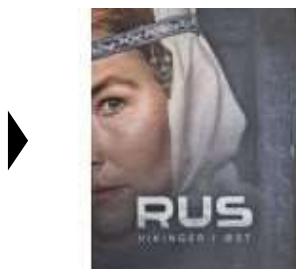
RUS - VIKINGER I ØST

( https://www.historie-online.dk/boger/anmeldelser-5-5/vikingetid-og-middelalder-13-13-13-13/rus-vinger-i-oest ) ( https://www.historie-online.dk/boger/med-ord-og-ikke-