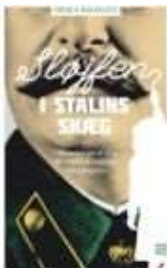
SLØJFEN I STALINS SKÆG

( https://www.historie-online.dk/boger/sloejfen-i-stalins-skaeg ) (/article/items/view/2871/4)