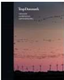
TRAP DANMARK 17 TØNDER, AABENRAA, SØNDERBORG

( https://www.historie-online.dk/boger/trap-danmark-17-toender-aabenraa-soenderborg )