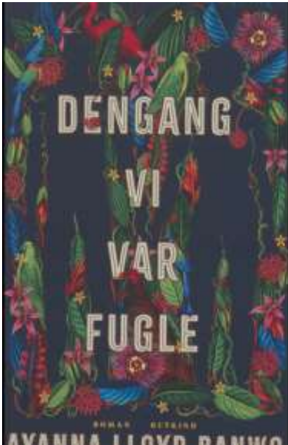
(/boeger/dengang-vi-var-fugle) DENGANG VI VAR FUGLE (/BOEGER/DENGANG-VI-VAR-FUGLE) Af Ayanna Lloyd Banwo