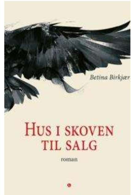
(/boeger/hus-i-skoven-til-salg-roman) HUS I SKOVEN TIL SALG (/BOEGER/HUS-I-SKOVEN-TIL-SALG-ROMAN) Af Betina Birkjær