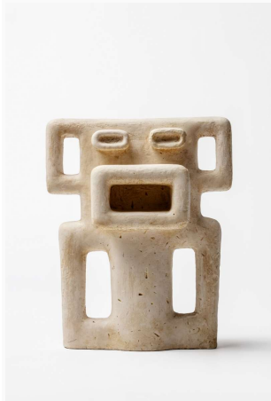
Skulpturen Maske (også kaldet Krigens udbrud ) fra 1939.

møde med afrikansk kunst helt optaget af at lære og forstå og aflure hemmelighederne. Det er svært ikke at se hendes store kærlighed som en naturlig forlængelse af hendes betagelse af alt afrikansk.