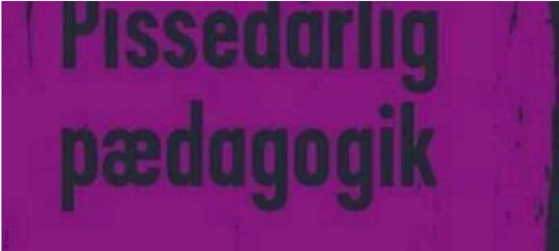
Uskarp debatbog om "pissedarlig pædagogik"