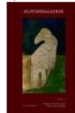
OLDTIDSSAGAERNE BD. 3

( https://www.historie-online.dk/boger/anmeldelser-5-5/vikingetid-og-middelalder-13-13-13-13/moerkets-skabninger )