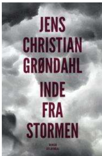
(/boeger/inde-fra-stormen-roman) INDE FRA STORMEN (/BOEGER/INDE-FRA-STORMEN- ROMAN) Af Jens Christian Grøndahl