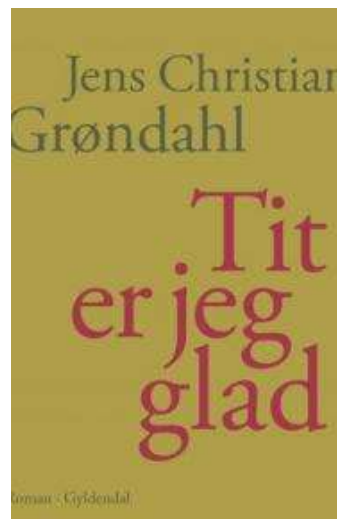
(/boeger/tit-er-jeg-glad) TIT ER JEG GLAD (/BOEGER/TIT-ER-JEG-GLAD) Af Jens Christian Grøndahl