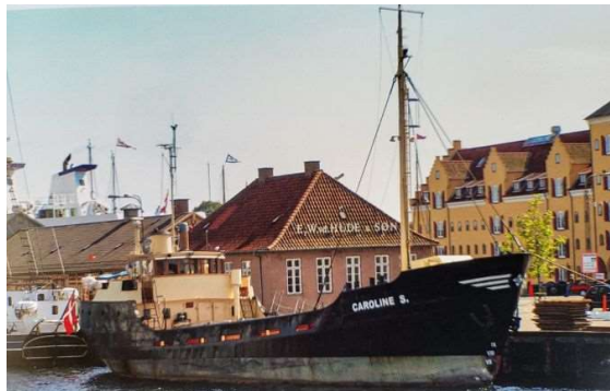
Caroline S. af Svendborg er en af de få tilbageværende coastere. Illustration fra bogen