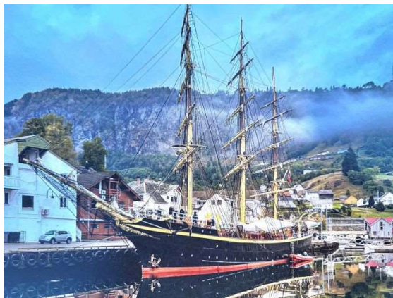
Georg Stage i norsk havn. Billede fra bogen