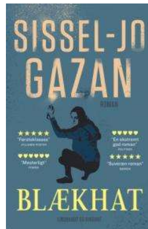
(/boeger/blaekhat) BLÆKHAT (/BOEGER/BLÆKHAT) Af Sissel-Jo Gazan