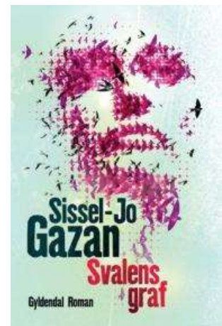
(/boeger/svalens-graf) SVALENS GRAF (/BOEGER/SVALENS-GRAF) Af Sissel-Jo Reid Gazan