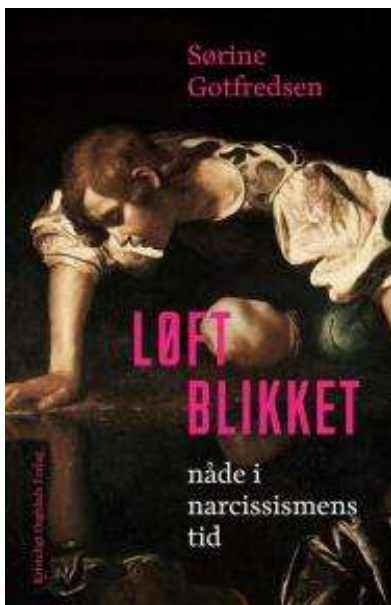
(/boeger/loft-blikket) LØFT BLIKKET (/BOEGER/LOFT-BLIKKET) Af Sørine Gotfredsen