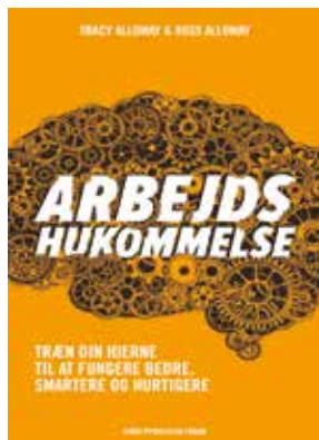
Af Tracy Alloway og Ross Alloway 349 kr.