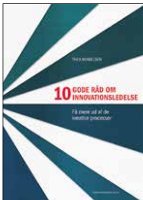
Af Thea Mikkelsen 299 kr.