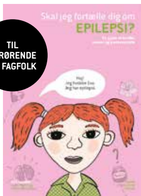
Af Kate Lambert 149 kr.