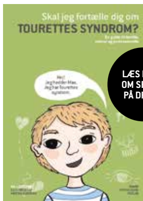
Af Mal Leicester 149 kr.