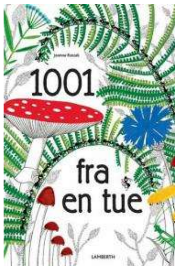
(/boeger/1001-fra-en-tue) 1001 FRA EN TUE (/BOEGER/1001-FRA-EN-TUE) Af Joanna Rzezak