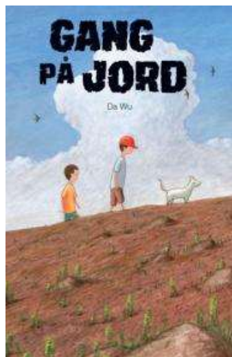
(/boeger/gang-paa-jord) GANG PÅ JORD (/BOEGER/GANG-PAA-JORD) Af Wu Da