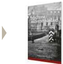
VOGTERNE I HELVEDES FORGÅRD

( http://www.historie-online.dk/boger/vogterne-i-helvedes-forgaard )