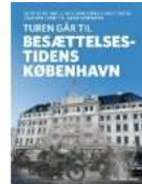
TUREN GÅR TIL BESÆTTELSESTIDENS KØBENHAVN

( http://www.historie-online.dk/boger/anmeldelser-5-5/besaettelsen/fabrikanten )