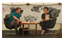
"Jeg er forfatter, ikke en politisk figur?" 22/08/2016