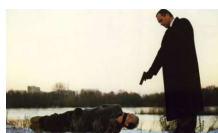
Ny polsk film 06/10/2011