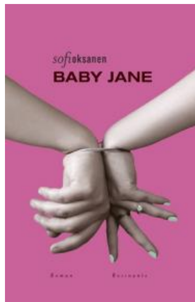
(/boeger/baby-jane) BABY JANE (/BOEGER/BABY-JANE) Af Sofi Oksanen