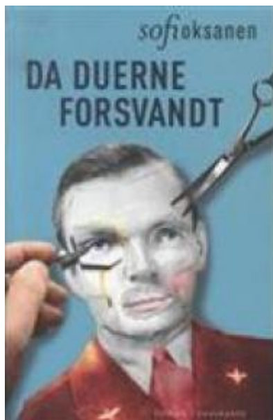
(/boeger/da-duerne-forsvandt) DA DUERNE FORSVANDT (/BOEGER/DA-DUERNE- FORSVANDT) Af Sofi Oksanen