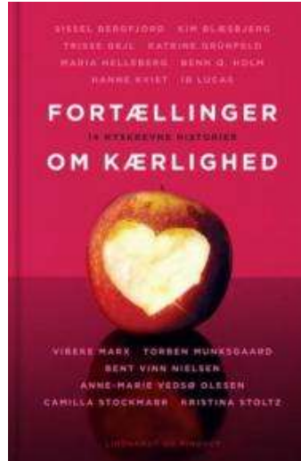
(/boeger/fortaellinger-om-kaerlighed-0) FORTÆLLINGER OM KÆRLIGHED (/BOEGER/FORTAELLINGER-OM-KAERLIGHED-0) Af Sissel Bergfjord