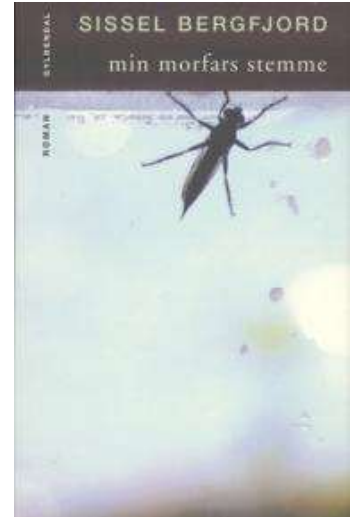
(/boeger/min-morfars-stemme) MIN MORFARS STEMME (/BOEGER/MIN-MORFARS-STEMME) Af Sissel Bergfjord