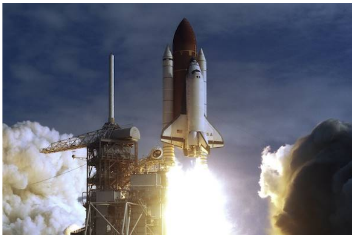
En syg organisationskultur var årsagen til Columbia-ulykken i 2003.

Ifølge Roux-Dufort findes pludselige kriser (næsten) ikke, og årsagerne til en krise kan meget ofte findes i organisationskulturen. Det viste sig for eksempel at være tilfældet med Columbia-ulykken i 2003, hvor en amerikansk rumraket styrtede ned, da den var på vej tilbage til jordens atmosfære, og syv amerikanske astronauter blev dræbt. Efterfølgende undersøgelser viste, at ulykken havde rod i en syg kultur, hvor kommunikation blev kvalt, medarbejdere, der satte spørgsmålstejn ved procedurer og processer, blev tiet ihjel, og man ikke måtte kritisere den måde, beslutninger blev truffet på.