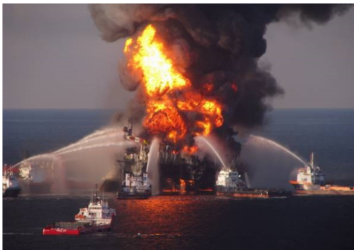
Ulykken på Deepwater Horizon-boreplatformen lækkede i alt 4,9 millioner tønder olie ud i havet og BP blev både af medier og af USAs regering udpeget til at være den ansvarlige for ulykken.

Ekspllosionen på Deepwater Horizon-boreplatformen i Den Mexicanske Golf i 2010 er et eksempel på en kompleks krise, hvor krisehåndteringen gik helt galt. Det er en krise med mange interessenter: offentligheden generelt, lokalbefolkningen, de dræbtes familier, den amerikanske administration og miljømyndighederne for bare at nævne nogle. Krisen blev en katastrofe både for Den Mexicanske Golf og BP. BP's ledelse troede, at de kunne styre både begivenhederne og kommunikationen. De lovede at stoppe udslippet hurtigt. Der gik næsten tre måneder, inden de fik lagt låg på. De tilbageholdt oplysninger og forsøgte at fremstille skadevirkningerne som mindre omfangsrige, end de i virkeligheden var. BP mistede ved katastrofen ikke blot milliarder af dollars, også organisationens troværdighed led ubodelig skade.