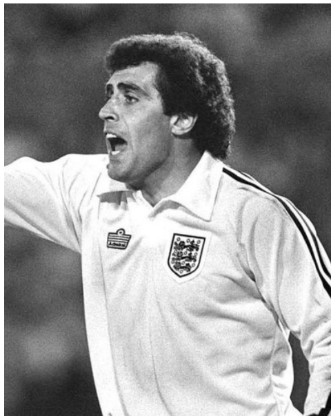
NOTTINGHAM FOREST-MÅLMANDEN PETER SHILTON VAR I SLUTNINGEN AF 1970ERNE DEN BEDST BETALTE SPILLER I ENGLAND MED EN UGELØN PÅ 1.200 PUND.

Der er med tv-aftalernes indtog i 1990'erne og investeringer fra alverdens fjerne egne i det nye årtusind blevet tilført uhørt høje summer til de store ligaer, der gør klubberne økonomisk muskuløse. Det skaber en mere ulige sport. Ser man på sidste års mesterskaber i Europa blev den pointe bekræftet. I Spanien, Frankrig, England, Tyskland og Italien genvandt sidste års vindere ligaen.