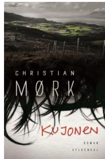
(/boeger/kujonen) KUJONEN (/BOEGER/KUJONEN) Af Christian Mørk