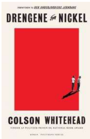
(/boeger/drengene-fra-nickel) DRENGENE FRA NICKEL (/BOEGER/DRENGENE-FRA-NICKEL) Af Colson Whitehead