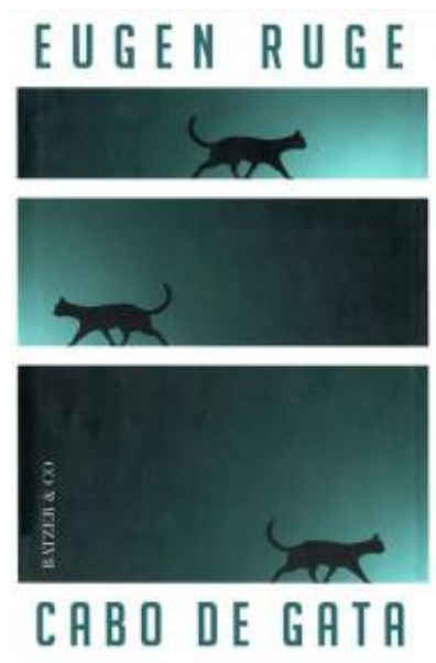
(/boeger/cabo-de-gata) CABO DE GATA (/BOEGER/CABO-DE-GATA) Af Eugen Ruge