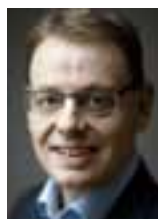
Af Jann Sjursen

D et omfattende socialhistoriske projekt 'Anbragt i historien' er netop blevet offentliggjort. Det er gennemført af Svendborg Museum og fortæller en vigtig og til tider