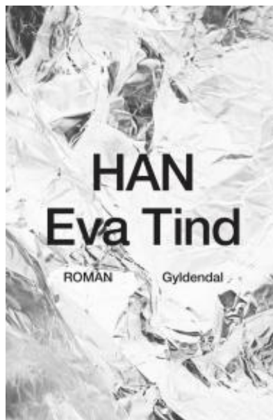
(/boeger/han) HAN (/BOEGER/HAN) Af Eva Tind