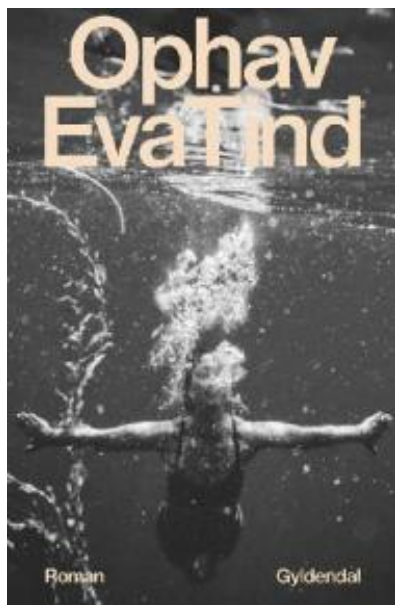
(/boeger/ophav-roman) OPHAV (/BOEGER/OPHAV-ROMAN) Af Eva Tind