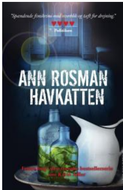
(/boeger/havkatten) HAVKATTEN (/BOEGER/HAVKATTEN) Af Ann Rosman