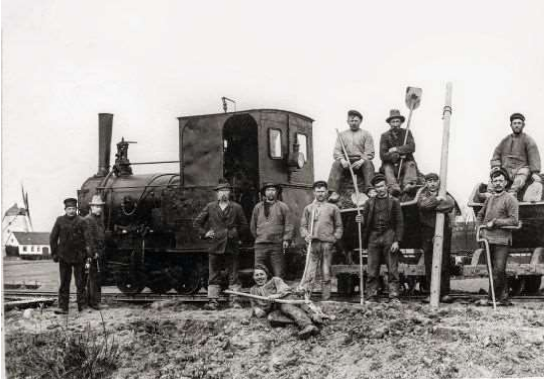
Mens de mange passagerer kunne sidde enten tavst eller i samtale i kupeerne, lagde jernbanebørsterne banen svelle for svelle og skinne for skinne gennem hårdt arbejde foran det nye damp tog

Sidst kommer kapitlet med overgangen til det nye årtusind 2000-2025, hvor der til sidst ses en åbning for en slags jernbanerenæssance med stigende fokus på kollektiv transport, nye elektrisk drevne lokomotiver, letbaner, metrobyggeri, batteridrevne tog på sidebanerne og vægtning af grøn udvikling.