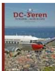
DC-3'EREN FRA ROSKILDE

( https://www.historie-online.dk/boger/anmeldelser-5-5/trafik-og-transport-videnskab-teknik/dc-3eren-fra-roskilde )