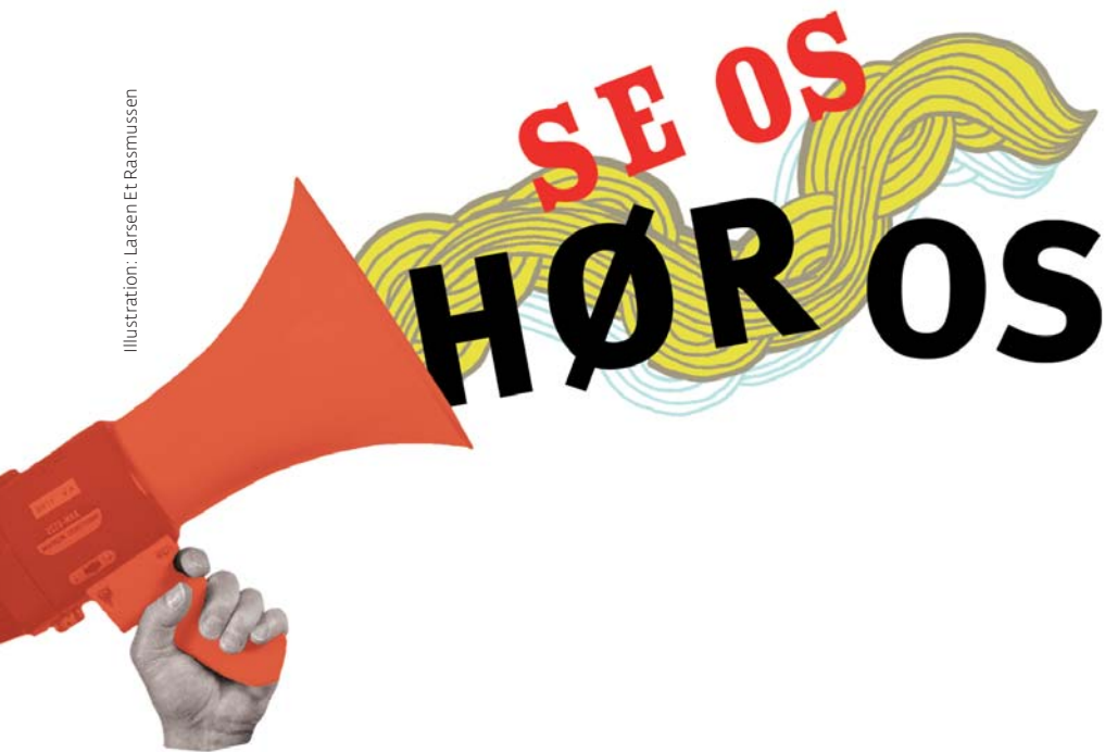
Illustration: Larsen Et Rasmussen

SKRIV TIL BØRN&UNGE Læserbreve sendes til bladdebat@bupl.dk Skriv højst 2400 enheder. Redaktionen forbeholder sig ret til at forkorte. Vi optager ikke anonyme indlæg. Du skal opgive navn og adresse. Læserbrevene bliver også lagt ud på www.boernogunge.dk