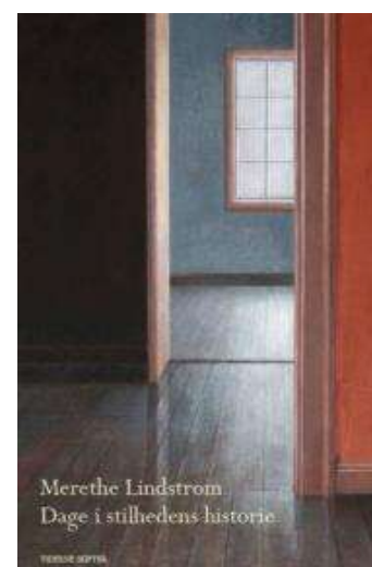
(/boeger/dage-i-stilhedens-historie) DAGE I STILHEDENS HISTORIE (/BOEGER/DAGE-I- STILHEDENS-HISTORIE) Af Merethe Lindstrøm