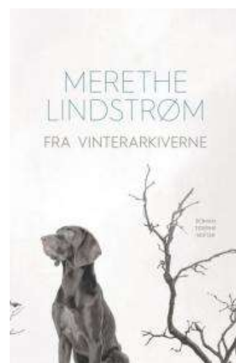
(/boeger/fra-vinterarkiverne) FRA VINTERARKIVERNE (/BOEGER/FRA- VINTERARKIVERNE) Af Merethe Lindstrøm