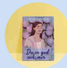
Du er god nok, mor! af Lise-Lotte Rudniak