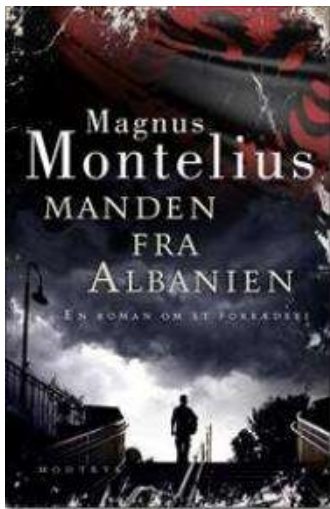
(/boeger/manden-fra-albanien) MANDEN FRA ALBANIEN (/BOEGER/MANDEN-FRA-ALBANIEN) Af Magnus Montelius