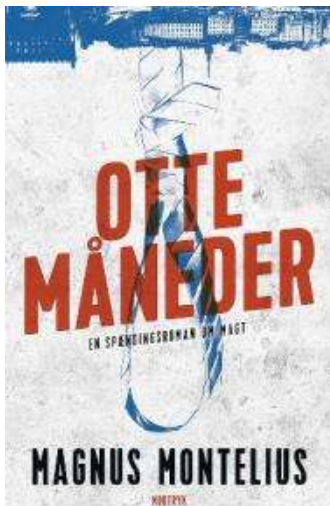
(/boeger/otte-maneder) OTTE MÅNEDER (/BOEGER/OTTE-MANEDER) Af Magnus Montelius