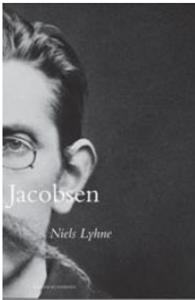
(/boeger/niels-lyhne-0) NIELS LYHNE (/BOEGER/NIELS-LYHNE-0) Af J. P. Jacobsen