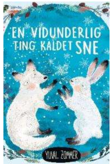
(/boeger/en-vidunderlig-ting-kaldet-sne) EN VIDUNDERLIG TING KALDET SNE (/BOEGER/EN-VIDUNDERLIG-TING-KALDET-SNE) Af Yuval Zommer