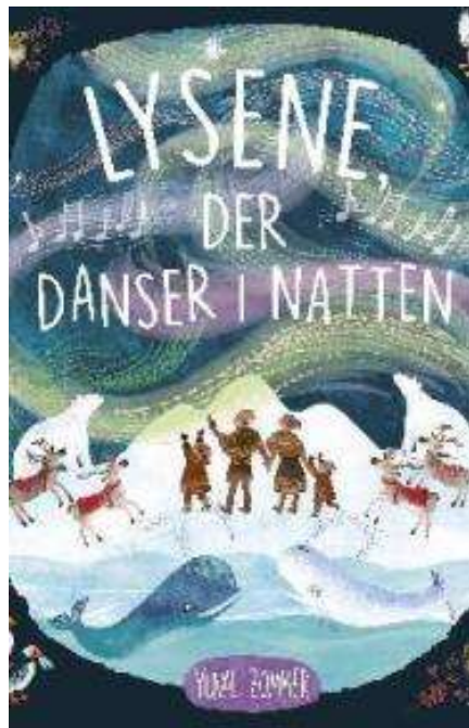
(/boeger/lysene-der-danser-i-natten) LYSENE, DER DANSER I NATTEN (/BOEGER/LYSENE- DER-DANSER-I-NATTEN) Af Yuval Zommer