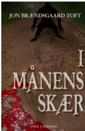
(/boeger/i-manens-skaer-0) I MÅNENS SKÆR (/BOEGER/I-MANENS-SKAER-0) Af Jon Brændsgaard Toft