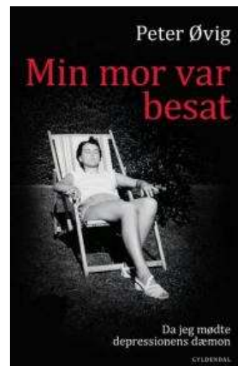
(/boeger/min-mor-var-besat-da-jeg-modte-depressionens-daemon) MIN MOR VAR BESAT: DA JEG MODTE DEPRESSIONENS DÆMON (/BOEGER/MIN-MOR-VAR-BESAT-DA-JEG-MODTE-DEPRESSIONENS-DAEMON) Af Peter Øvig