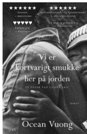
(/boeger/vi-er-kortvarigt-smukke-her-paa-jorden) VI ER KORTVARIGT SMUKKE HER PÅ JORDEN (/BOEGER/VI-ER-KORTVARIGT-SMUKKE-HER-PAA-JORDEN) Af Ocean Vuong