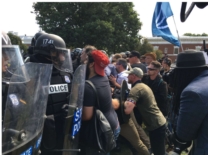
Højreradikale i sammenstød med politiet i Charlottesville, Virginia, i 2017.