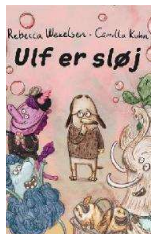
(/boeger/ulf-er-sloej) ULF ER SLOJ (/BOEGER/ULF-ER-SLOEJ) Af Rebecca Wexelsen