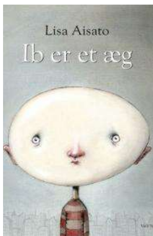
(/boeger/ib-er-et-aeg) IB ER ET ÆG (/BOEGER/IB-ER-ET-AEG) Af Lisa Aisato