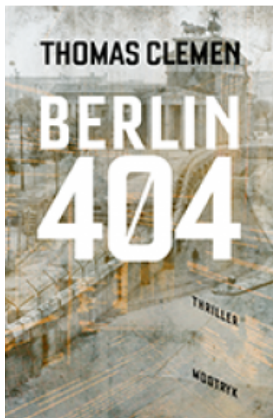
(/boeger/berlin-404) BERLIN 404 (/BOEGER/BERLIN-404) Af Thomas Clemen