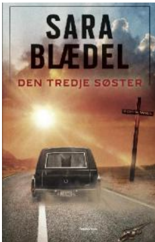
(/boeger/den-tredje-soster-0) DEN TREDJE SØSTER (/BOEGER/DEN-TREDJE-SOSTER-0) Af Sara Blædel