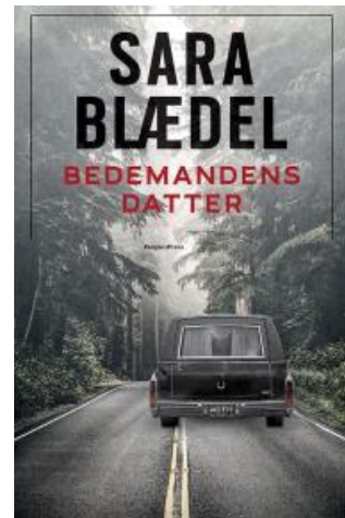
(/boeger/bedemandens-datter-0) BEDEMANDENS DATTER (/BOEGER/BEDEMANDENS-DATTER-0) Af Sara Blædel