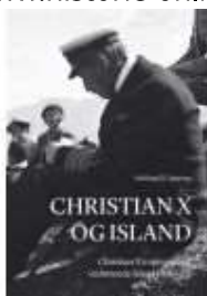
CHRISTIAN X OG ISLAND

( http://www.historie-online.dk/boger/konge-af-luthers-naade )