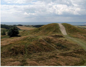
Et strejf af askeviolet i Mols Bjerge.