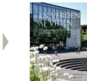
EN VERDEN AF VIDEN

( http://www.historie-online.dk/boger/en-verden-af-viden )