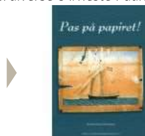
PAS PÅ PAPIRET!

( http://www.historie-online.dk/boger/anmeldelser-5-5/diverse-84/hest-i-danmark )