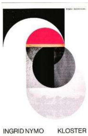
(/boeger/kloster-roman) KLOSTER (/BOEGER/KLOSTER-ROMAN) Af Ingrid Nymo